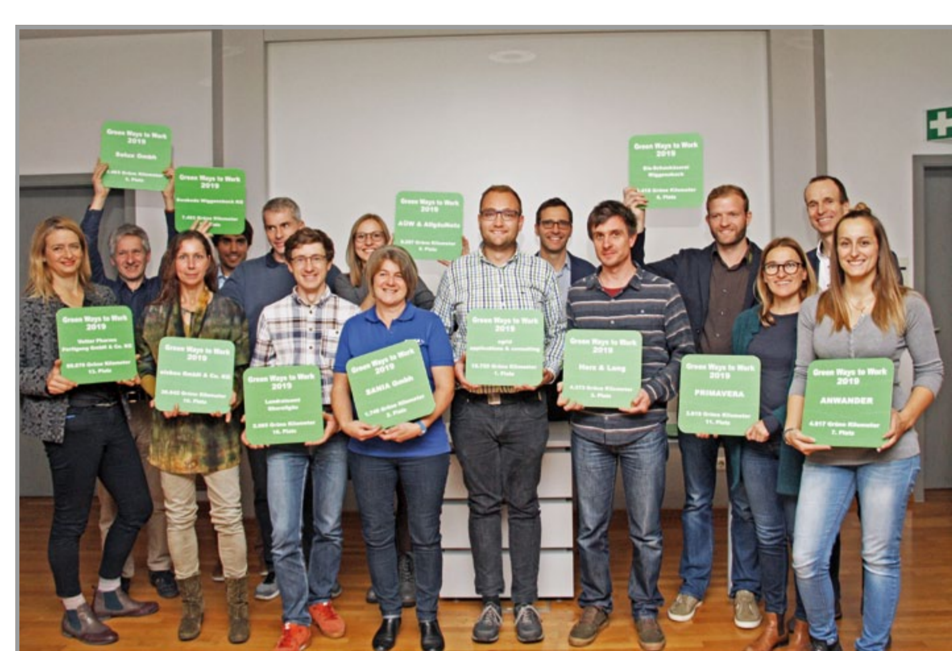
Urkundenübergabe an die teilnehmenden Unternehmen

Mit der täglichen Erfassung über eine Web-App und die Auswertung über eine aktuelle Rangliste können Mitarbeiter der teilnehmenden Unternehmen zu Änderungen ihres Mobilitätsverhaltens motiviert werden.